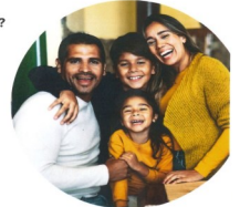
La presentación será en español.

Día: Sábado, 22 de julio Hora: 11:00 AM Iglesia San Antonio 309 Benton Blvd, Kansas City, MO 64124